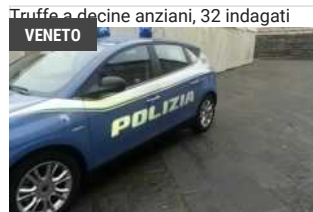
5TH APRILE, 2018 Truffe a decine anziani, 32 indagati