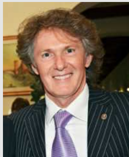
Diego Cordioli Editore