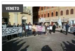
3RD APRILE, 2018 Ue, 4,7mld su deficit per banche venete