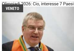
3RD APRILE, 2018 Olimpiadi 2026: Cio, interesse 7 Paesi